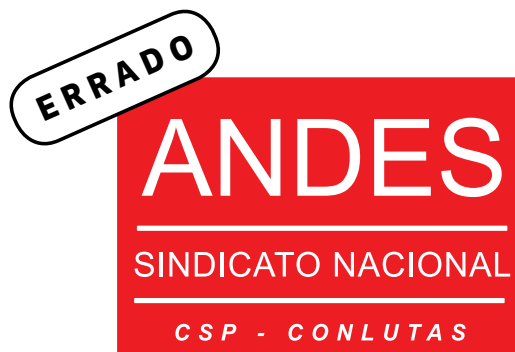
Foi alterada a tipologia