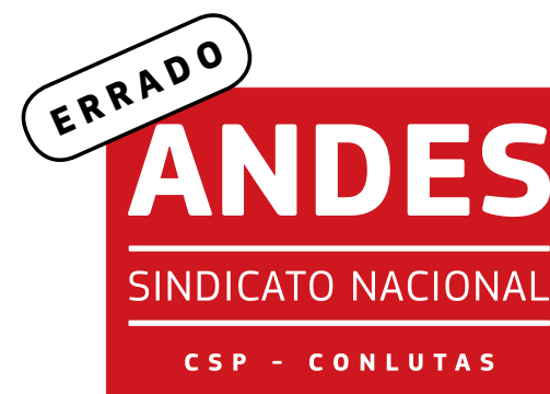
Foi alterada a cor da marca