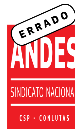
A marca foi deformada