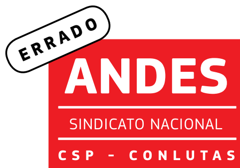
Foi alterada a proporção entre os elementos